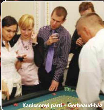
Karácsonyi parti – Gerbeaud-ház