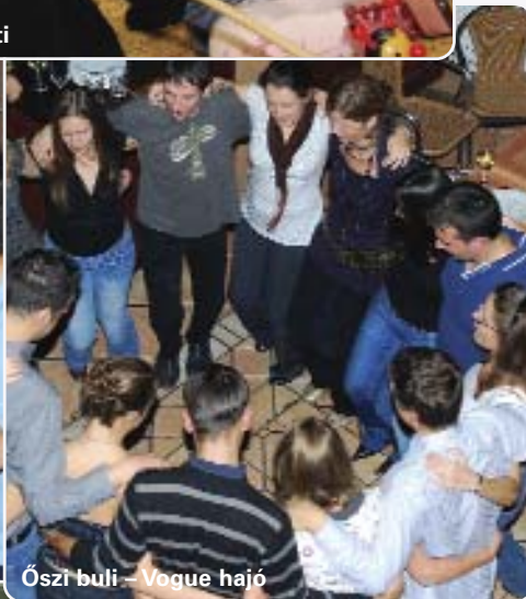
Őszi buli – Vogue hajó