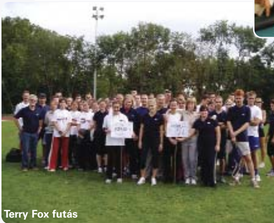
Terry Fox futás