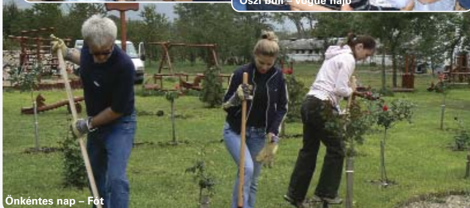
Önkéntes nap – Fót