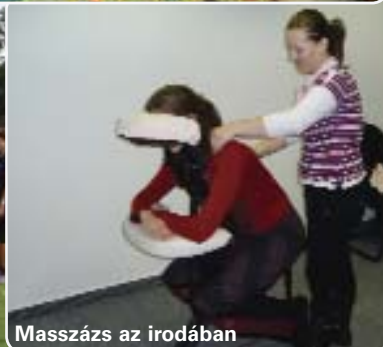
Masszázs az irodában