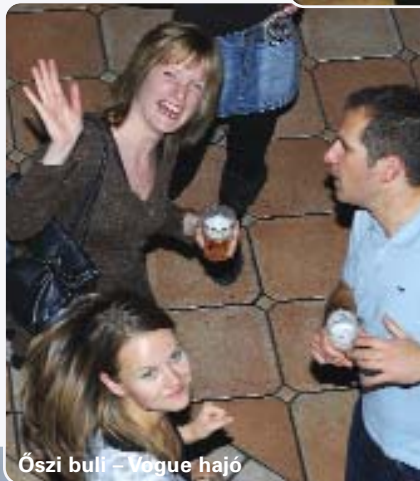
Őszi buli – Vogue hajó